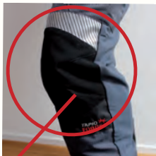
Vorgeformte Knie aus hochrobustem Kevlar