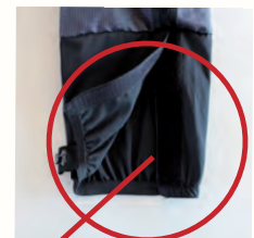
Gamasche mit Haken zum Schutz vor Zecken und Schnee