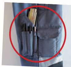
Handy- und Metertasche